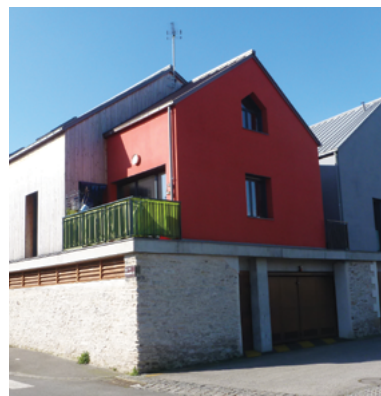
Une conception adaptée est incontournable pour intégrer le risque d'inondation de manière satisfaisante.