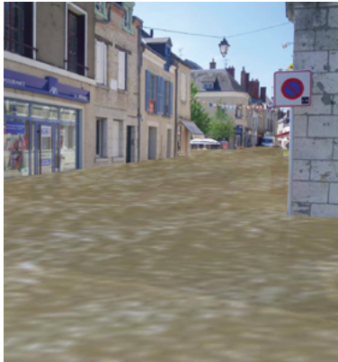
Simulation d'une rue de Jargeau lors d'une crue (photo-montage : DREAL Centre)