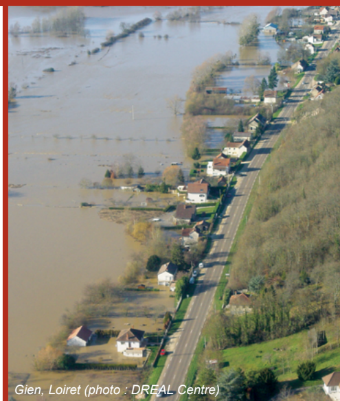
Gien, Loiret

« La parcelle est située à proximité d'un cours d'eau ou dans une vallée, un cadre agréable pour construire une habitation ! » Et pourtant, une opération immobilière envisagée en zone inondable peut rapidement devenir désastreuse lorsque l'aléa a été négligé. La conception d'un habitat adapté aux inondations ne s'improvise pas. Dès le commencement du projet il est impératif d'intégrer le risque d'inondation afin d'éviter la mise en danger des personnes et des biens en cas de montée des eaux.