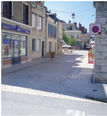
Jargeau, Loiret