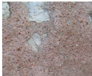
Enduit au mortier de tuileau

Les enduits sont la peau de la façade, c'est leur ruine qui a fait apparaître les moellons. À l'exception de la Beauce, la majorité des bâtiments traditionnels réalisés en maçonnerie dans le département présente des enduits à la chaux naturelle couvrant totalement les maçonneries. En effet, bien que les murs aient été construits en pierres calcaires et rognons de silex, la qualité médiocre des liants ne permettait pas de laisser les parements exposés aux vents chargés de pluie. Une protection était nécessaire sous la forme d'un enduit de chaux naturelle couvrant. Dans la plupart des cas, les seules pierres qui doivent rester apparentes sont des pierres appareillées (chaînages, encadrements,...). En général, l'enduit affleure les pierres d'encadrement et de chaînage.