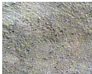
Enduit brossé couvrant